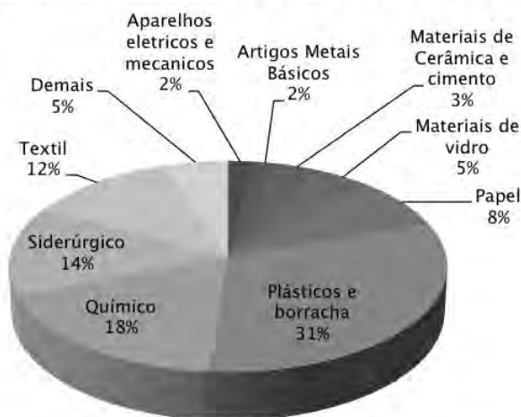
Gráfico 3 Aplicação de medidas antidumping – setores afetados (janeiro a dezembro de 2008 a 2015)