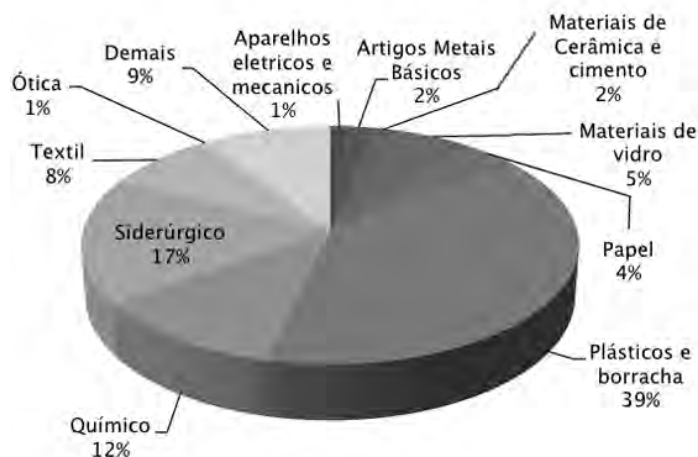
Gráfico 2 Abertura de investigação antidumping – setores afetados (janeiro a dezembro de 2008 a 2015)