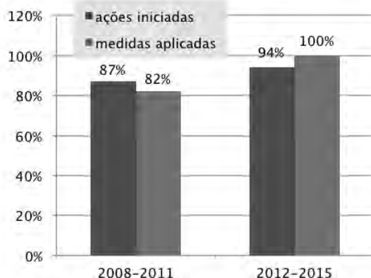
Gráfico 4 Incidência das medidas antidumping contra produtos intermediários Comparação entre os quadriênios 2008-2011 e 2012-2015