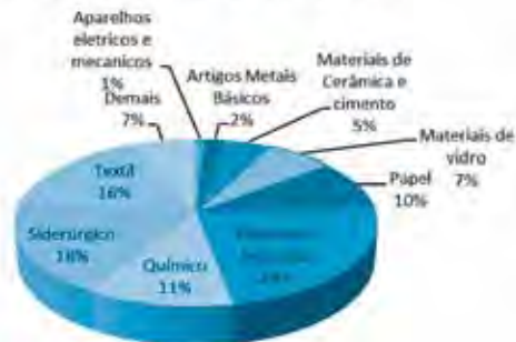
Gráfico 3 Aplicação de medidas antidumping Setores afetados Janeiro a dezembro (2008-2014)