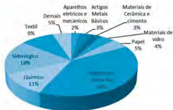
Gráfico 2 Abertura de investigação antidumping Setores afetados Janeiro a dezembro (2008-2014)

O período 2008-2014 mostra a elevada concentração das aberturas de investigação sobre produtos intermediários – 95% das aberturas tiveram como alvo produtos dos setores de plásticos e borracha, siderúrgico, químico, materiais de vidro, elétricos e mecânico, metais básicos, materiais de cerâmica e cimento e matérias-primas para a indústria de papel e têxtil. O mesmo se observa na aplicação de medidas; a participação desses setores no total das medidas aplicadas foi de 93% no período 2008-2014 (Gráficos 2 e 3). Note-se que em relação ao acumulado de 2008 a 2013, essas participações se mantêm praticamente estáveis (91% e 93%, respectivamente).